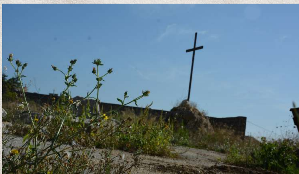
Ultime tracce della Chiesa Madre